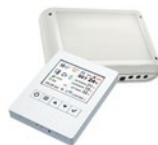
Kit Control Clever