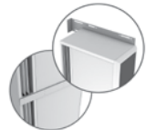
Kit de unión SPJ-KOOL (Galv. / inox)