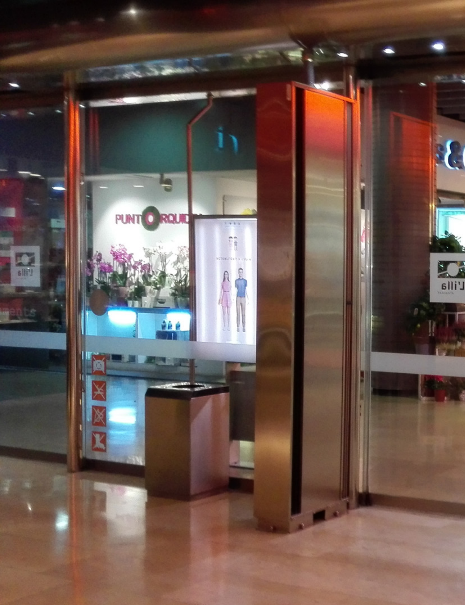
DAM, Twin system installation FNAC Illa Diagonal Store, Barcelona (Spain)