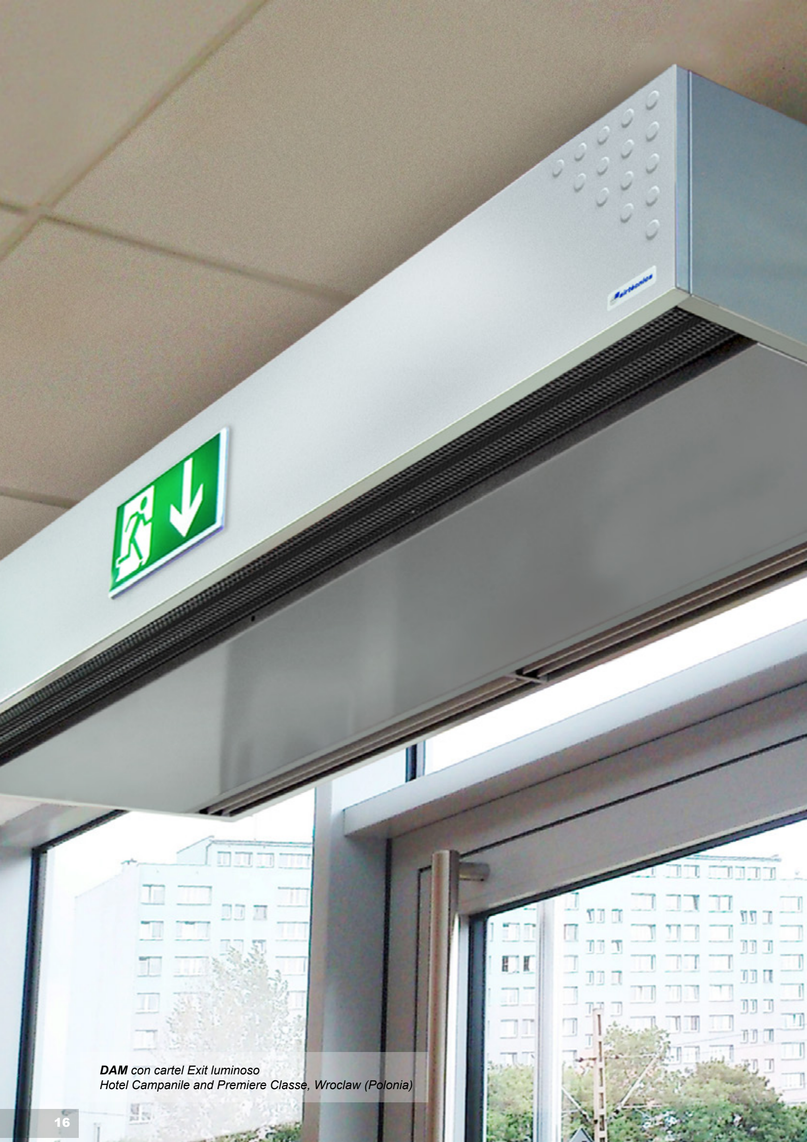
DAM con cartel Exit luminoso Hotel Campanile and Premiere Classe, Wroclaw (Polonia)