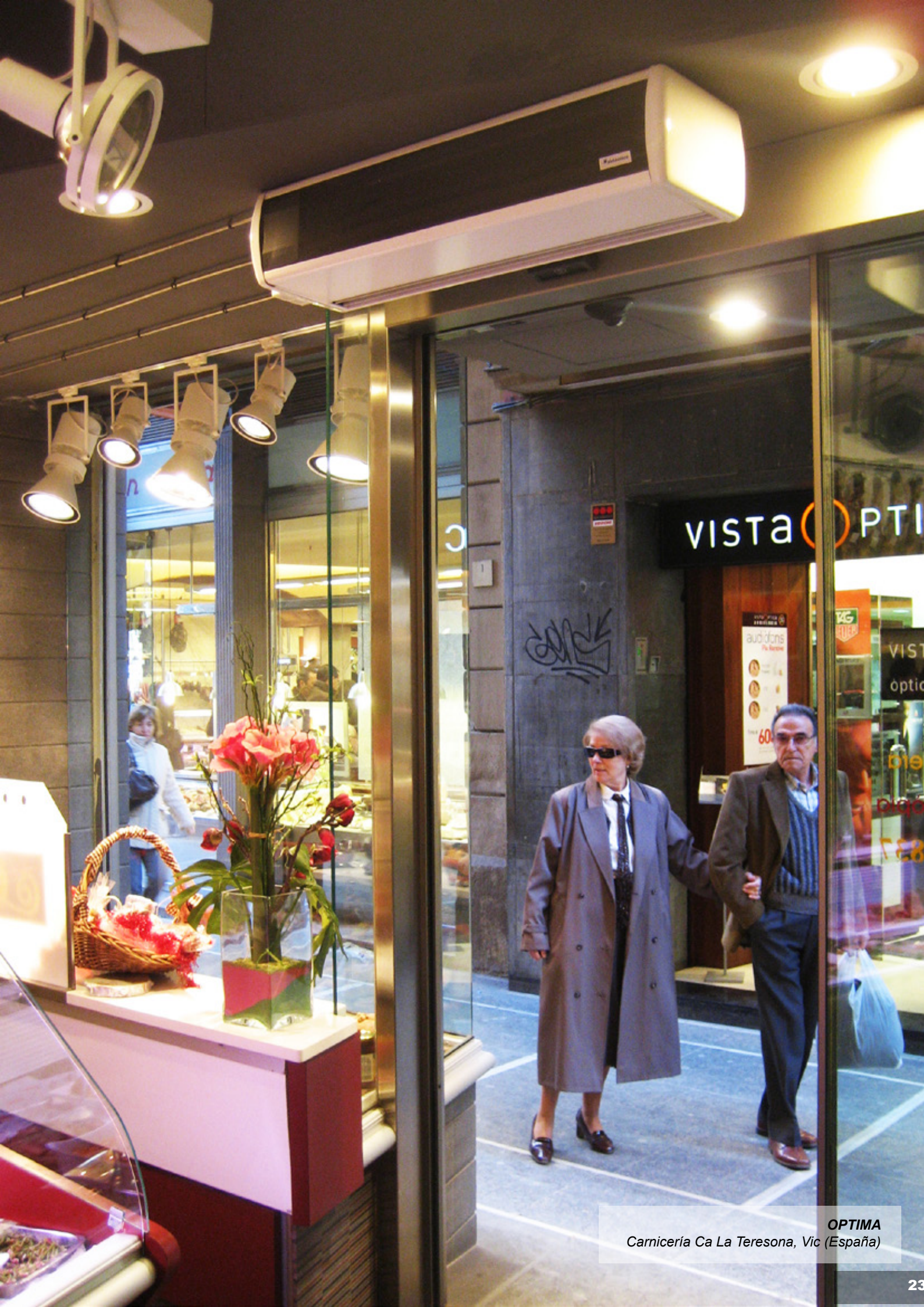
OPTIMA Carnicería Ca La Teresona, Vic (España)