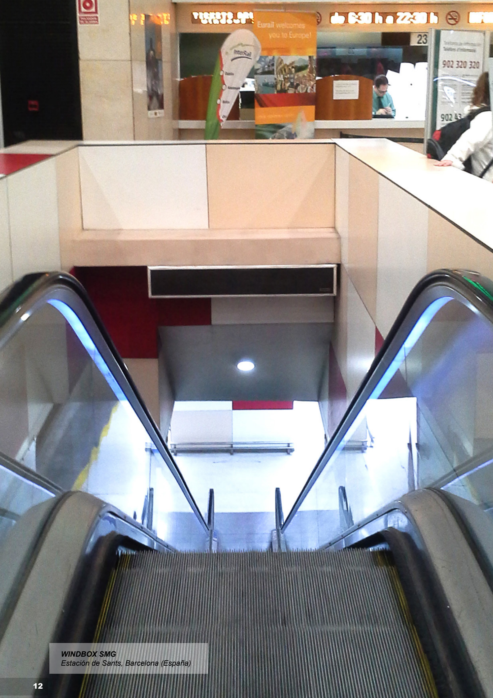
WINDBOX SMG Estación de Sants, Barcelona (España)