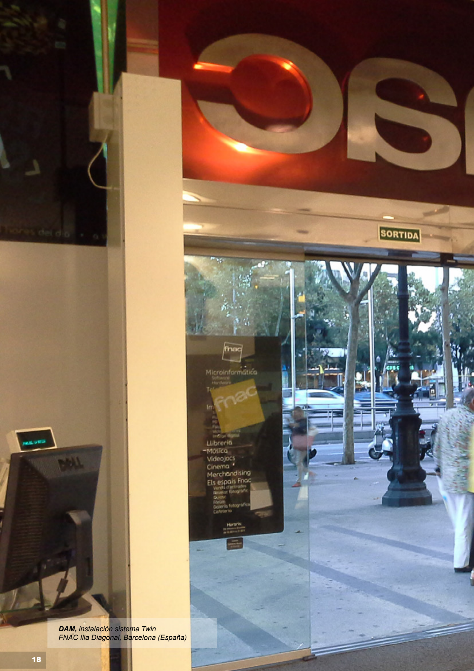
DAM, instal·lació sistema Twin FNAC Illa Diagonal, Barcelona (Espanya)