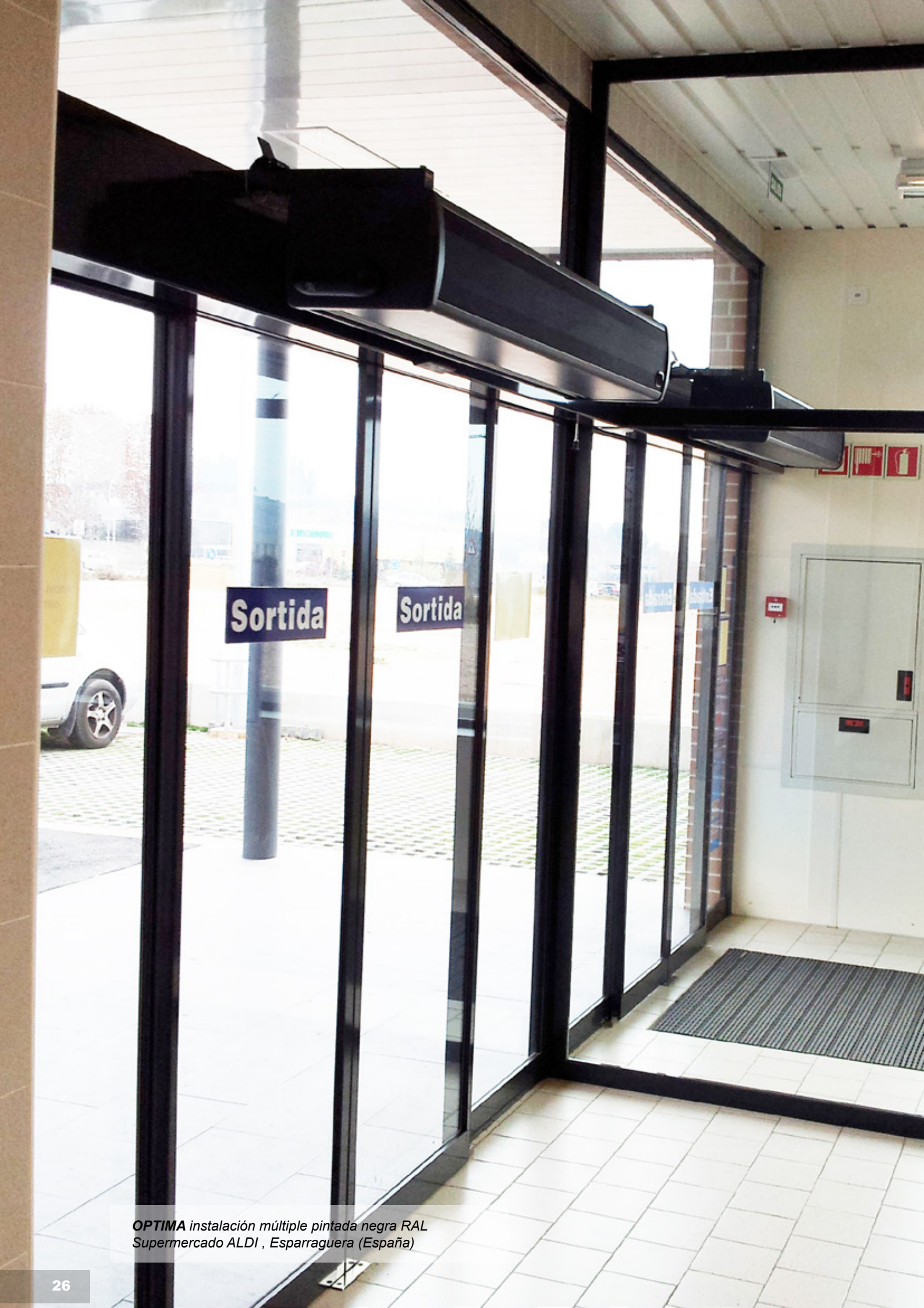
OPTIMA instalación múltiple pintada negra RAL Supermercado ALDI , Esparraguera (España)