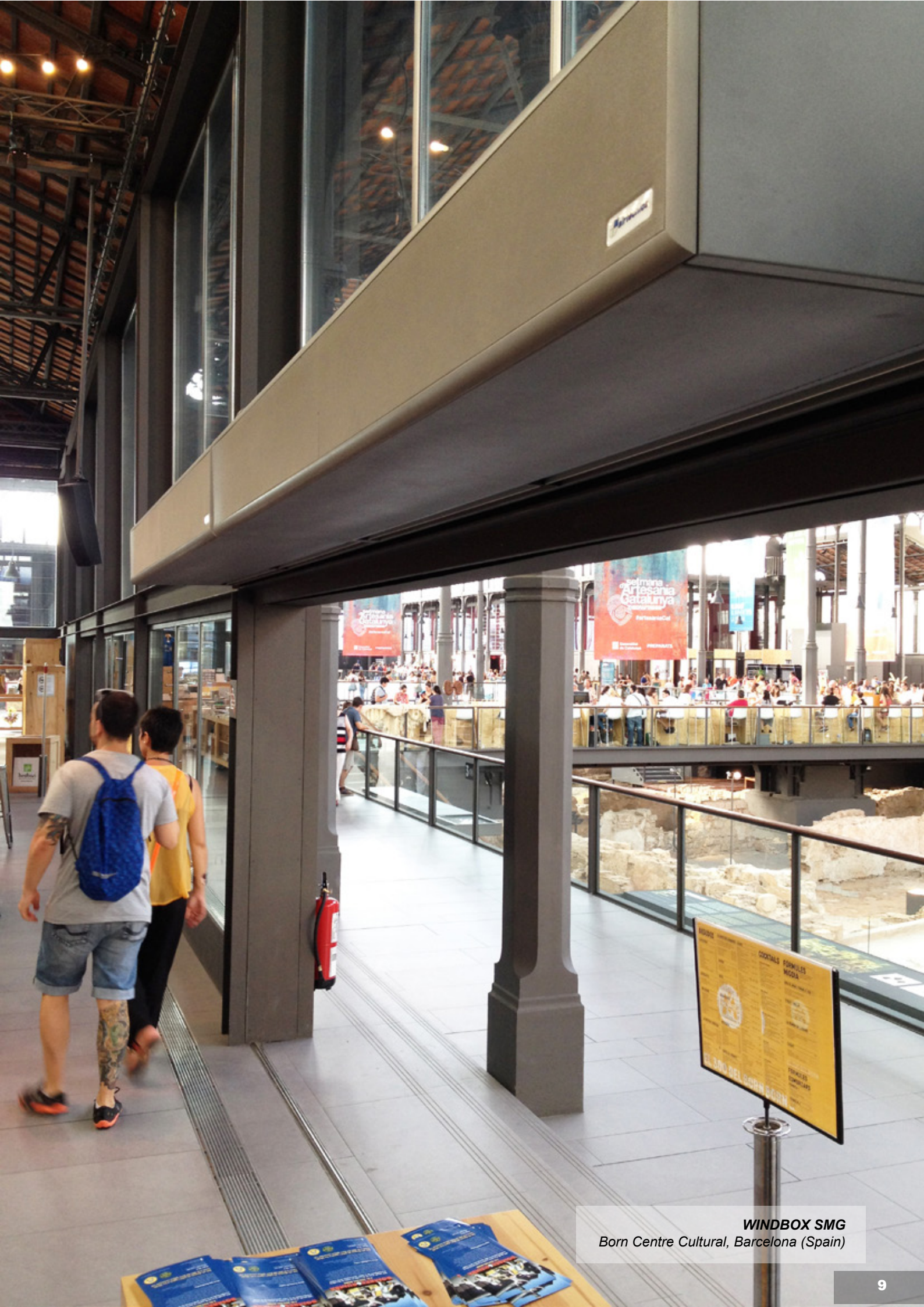
WINDBOX SMG Born Centre Cultural, Barcelona (Spain)