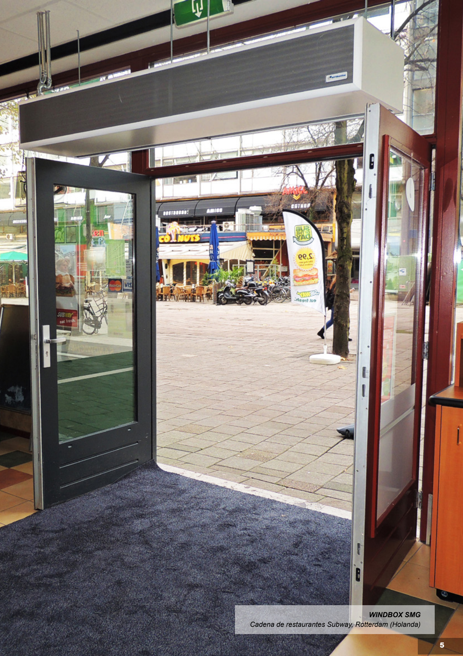
WINDBOX SMG Cadena de restaurantes Subway, Rotterdam (Holanda)