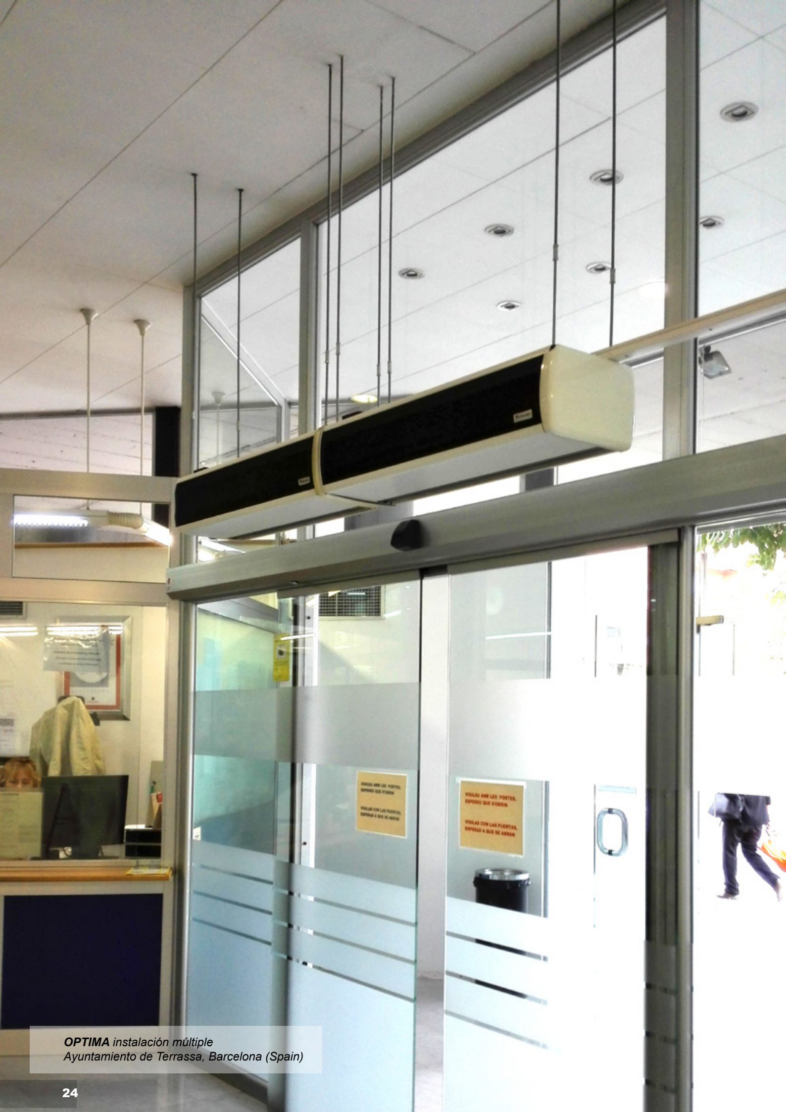
OPTIMA instalación múltiple Ayuntamiento de Terrassa, Barcelona (Spain)