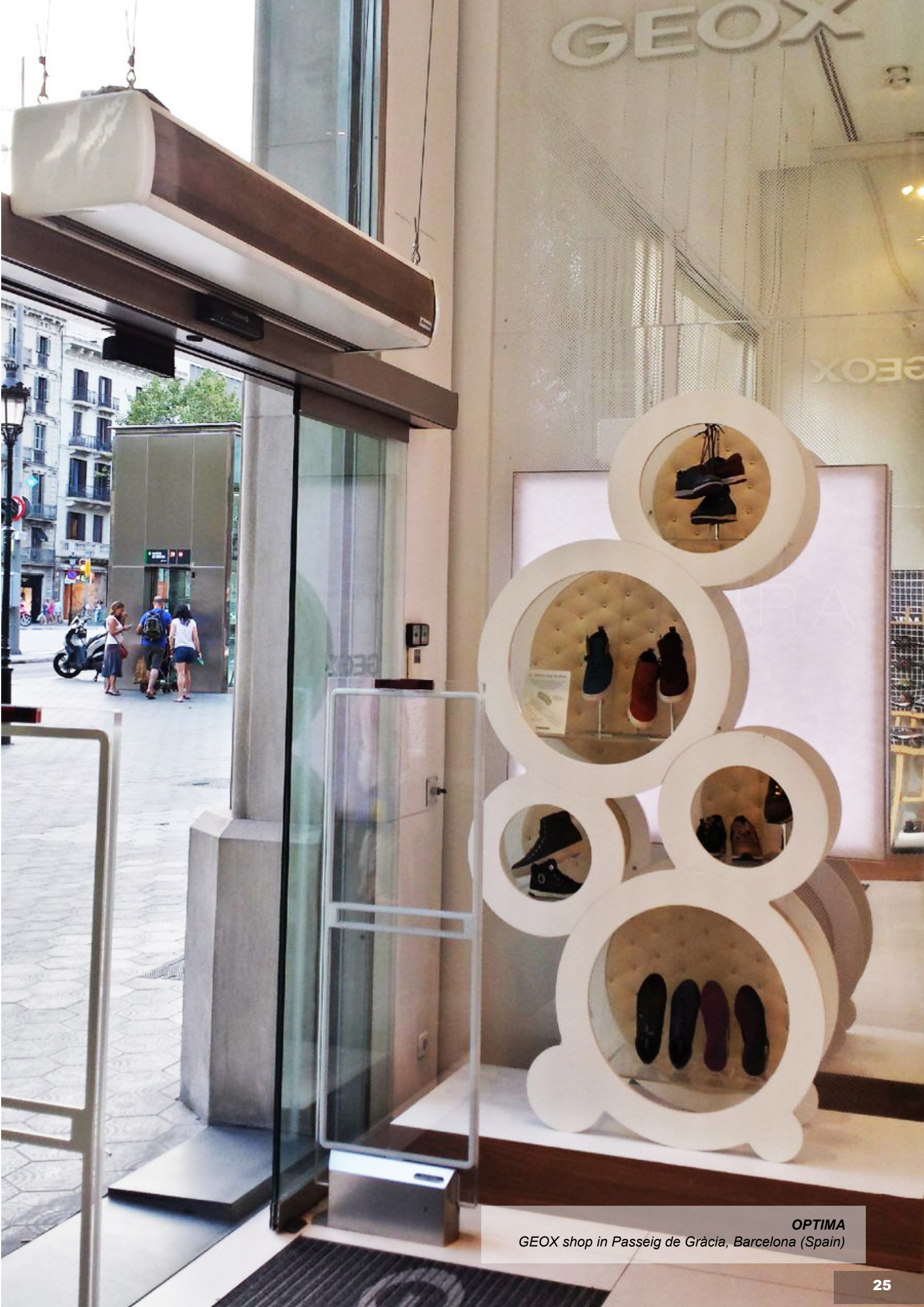
OPTIMA GEOX shop in Passeig de Gràcia, Barcelona (Spain)