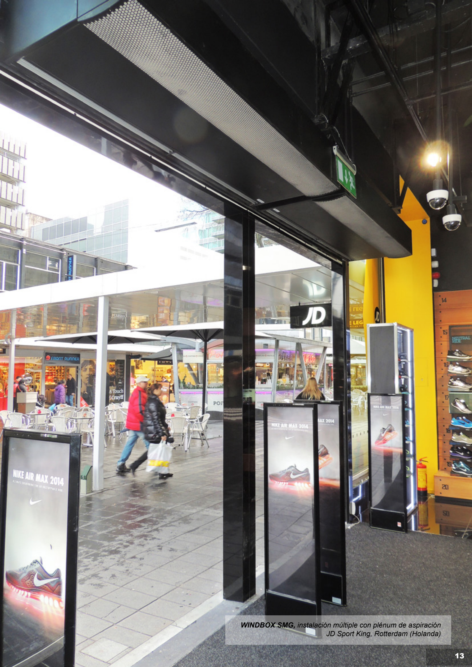
WINDBOX SMG, instalación múltiple con plénum de aspiración JD Sport King, Rotterdam (Holanda)