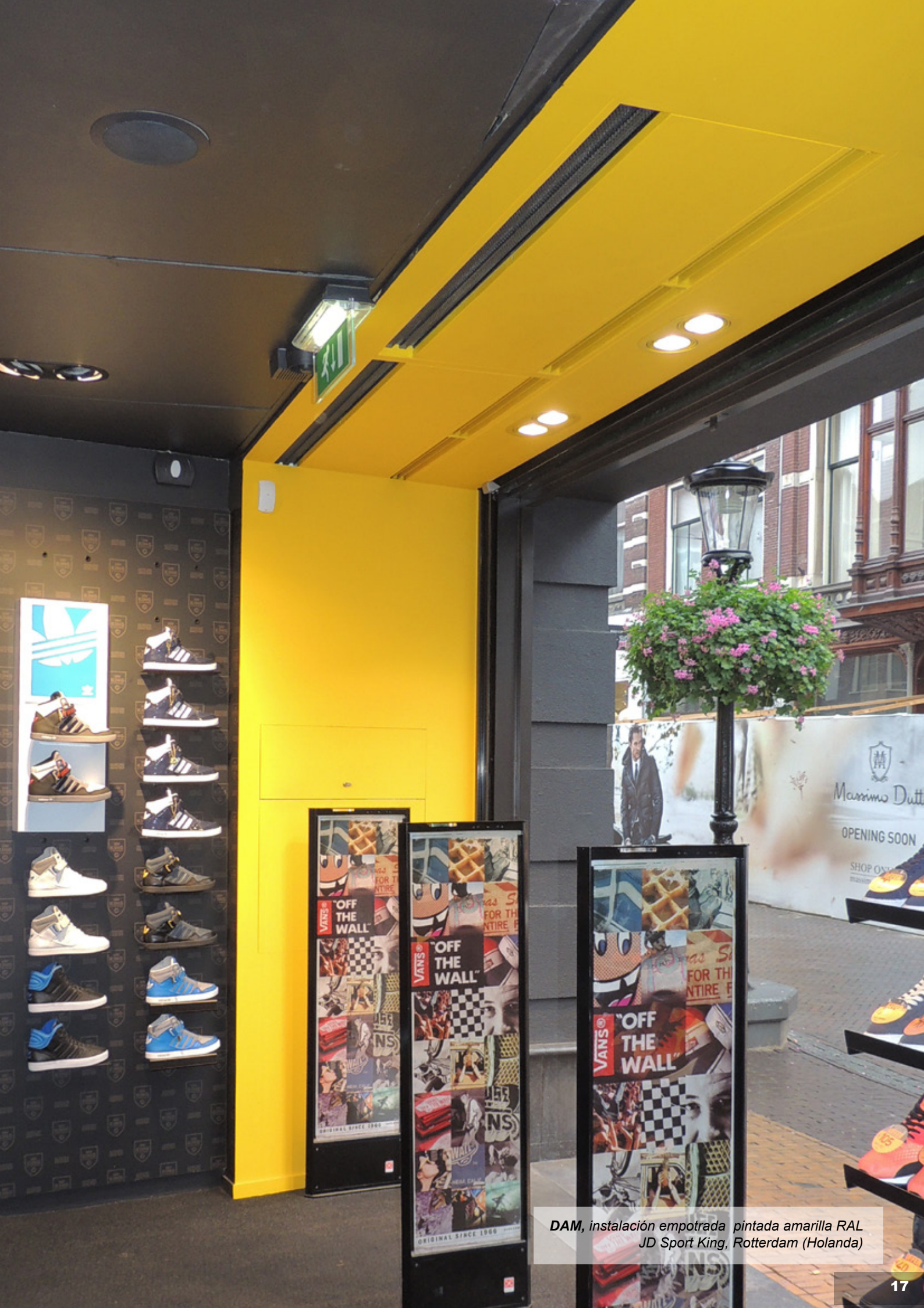
DAM, instalación empotrada pintada amarilla RAL JD Sport King, Rotterdam (Holanda)