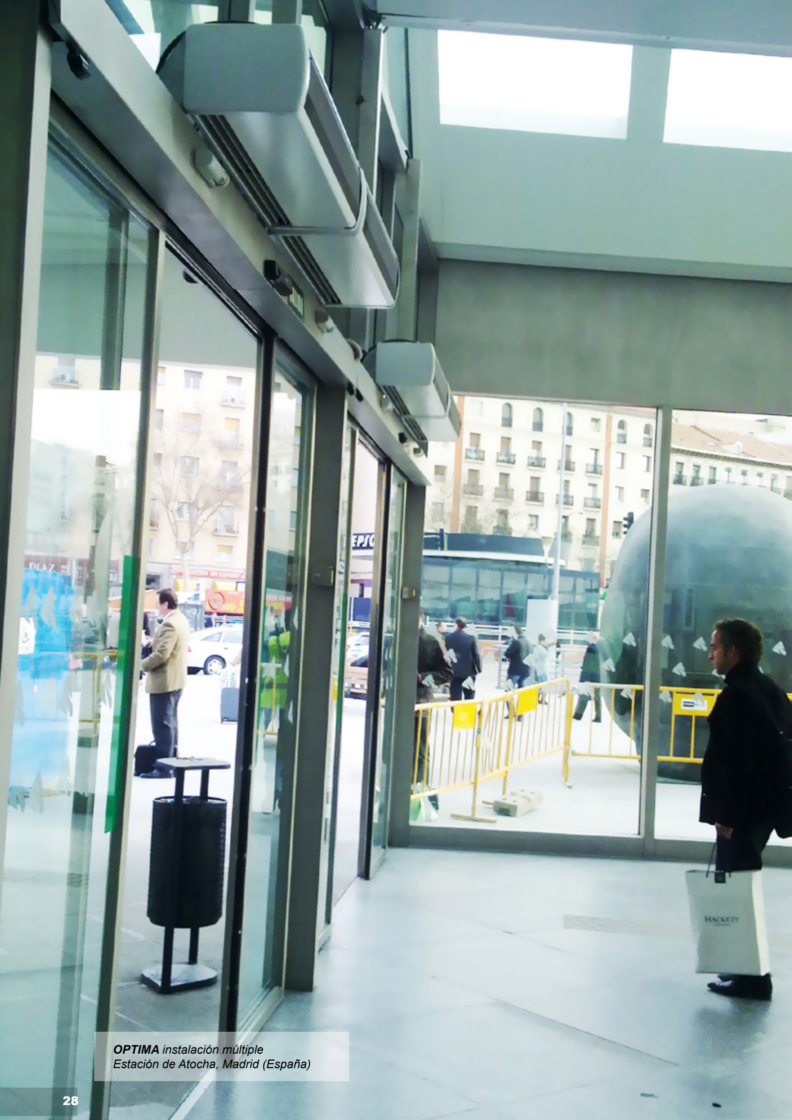
OPTIMA instalación múltiple Estación de Atocha, Madrid (España)